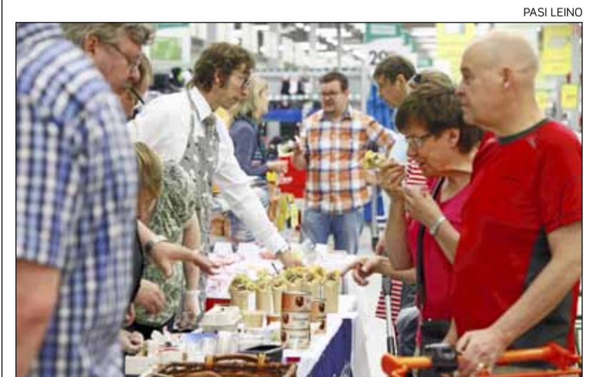
Raision Myllyn Prismassa avattiin perjantaina lähiruokatori. Kiinnostuneita oli tungokseksi saakka.