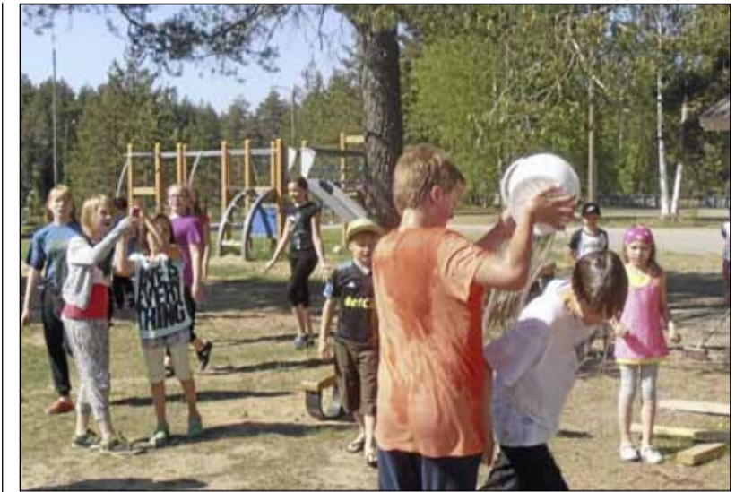
Kannuolaisessa Hanhinevan koulussa kuudesluokkalaiset kastelevat viidesluokkalaiset. Koulun lakkautuksesta päätetään ensi viikolla.

Nystun tilalla Paraisten Korppoossa naudat ja lampaat hoitavat luonnonlaitumia. WWF julkisti maanantaina tuotantovaatimukset luonnonlaidunlihalle. Sivu 11