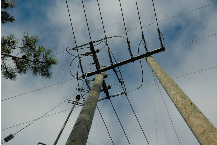
Kuva 4. Esimerkki turvallisesta pylvään yläosasta, jossa kaikki johdot ovat suojattuja (Kustavi, Anavainen)

Tämän hankkeen aikana Fortum Sähkösiirto Oy teki ensimmäiset suojausrakenteet talvela 2007-2008 ennen merikotkien pesintäkauden alkua. Ratkaisut perustuivat tunnettuihin menetelmiin rakentamalla istumaorsi pylvään latvaan ja vaihtamalla liitosjohdot PAS-johdoiksi eli päällystetyksi avojohdoksi. Toisaalta käytettiin myös nk. uven-huppua PAS-johdon kanssa.