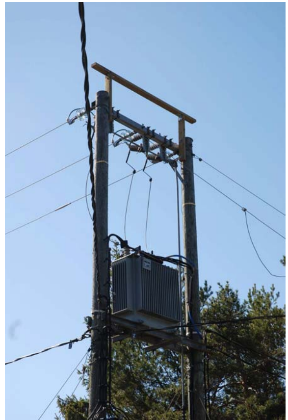
Kuva 3. Sama sähköpylväs orsisuojauksen jälkeen

Sähkönjakeluverkon suojauksia ja rakentamisperiaatteita on kehitetty vuosien saatossa jatkuvasti. Nykyisin rakennettavat uudet jakeluverkot ovatkin jo pääosin turvallisia merikotkille ja muille suurille petolinnuille. Uusissa verkoissa pyritään käyttämään suojattuja rakenteita niin, että paljaiden jännitteisten osien määrä olisi mahdollisimman pieni. Esimerkiksi perinteisten kirkkaiden ilmajohtojen sijasta käytetään päällystettyjä johtimia tai maa- ja merikaapeleita sekä pylväsmuuntamoiden sijasta puistomuuntamoita.