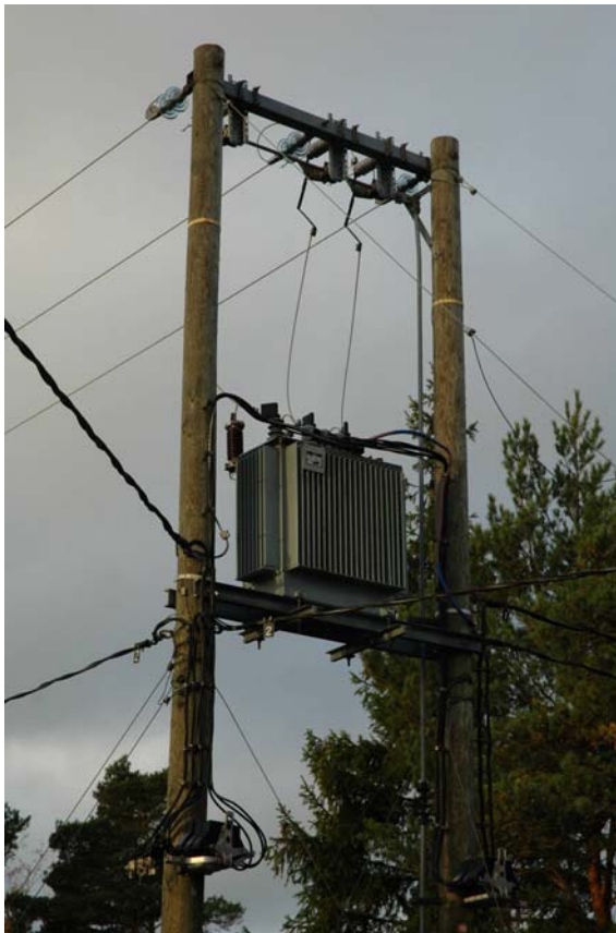
Kuva 2. Sähköpylväs ennen suojausta (Kustavi)

Rakenteiden suojaaminen parantaa sähkönjakelun luotettavuutta vähentämällä eläinten aiheuttamia jakelukeskeytyksiä. Eläinten aiheuttamien vikojen osuus on muutaman prosentin luokkaa kaikista tilastoiduista vioista. Vaikka osuus on pieni, kaikki keinot keskeytysten vähentämiseksi ovat tervetulleita erityisesti saaristossa, jossa välimatkat ovat pitkiä ja kulkuyhteydet hankalia.