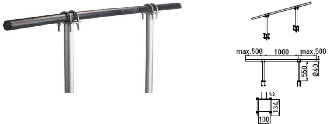
Kuva 5. Luontoystävällinen kotkaorsi (Ensto SH693).

Alla on kuvattu Ensto Oy:n suunnittelema ja markkinoima malli mittoineen.